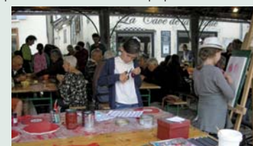
Un atelier de coquelicots