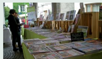
Le stand de Terre vivante