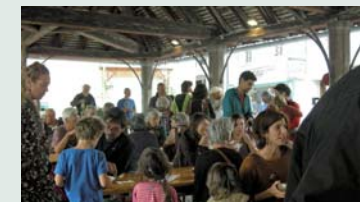
Le déjeuner sous la halle