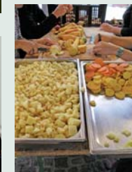
La préparation du dîner